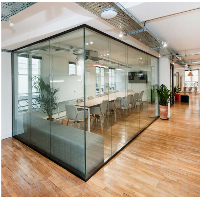
/ Bureaux – KPLER