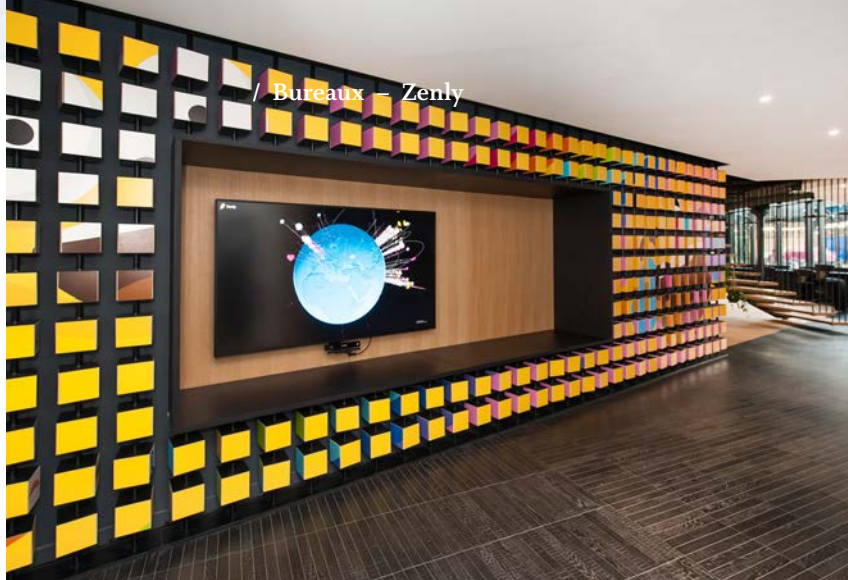
/ Bureaux – Zenly