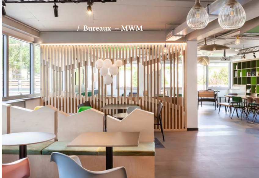
/ Bureaux – MWM