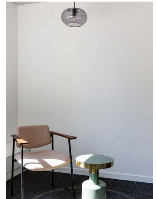
Intérieur des locaux MWM