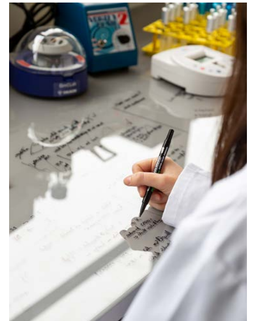
Intérieur du laboratoire