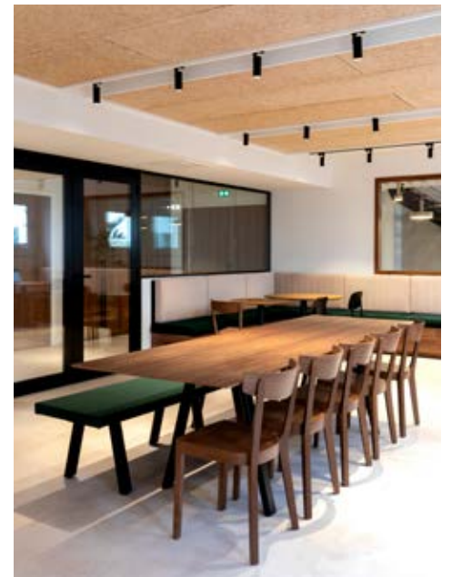
Dans les locaux d'ACL